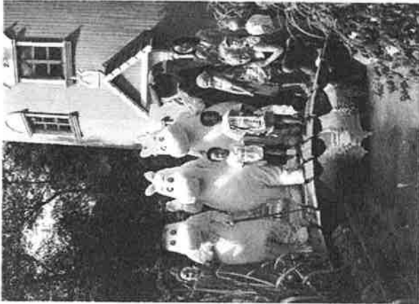
Toive-lainsaattimien muumihihmet tunnetaan ympäri maailmaa.