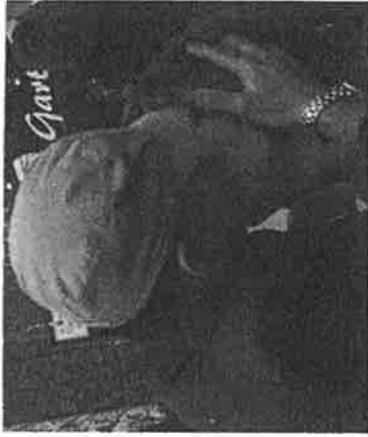
Berliinissä suomalaisen suikon.

Julkisuudiplomatia on ei-valtiollista vaikutusvoimaa, joka on erityisen tärkeää pienelle valtiolle. Julkisuudiplomatian vahvistamiseksi ulkoministeriö määrittä kymmenen tehostetun toiminnan kohteita, joille laadittu viestintä-, kulttuurin ja promootiota hyödyntävät julkisuudiplomatian maaohjelmia. Tehostetun toiminnan kohteet ovat Brasilia, Egypti, Intia, Kiina, Ranska, Saksa, Turkki, Venäjä, Ukraina ja Yhdysvallat. Maaojelmassa hyödynnetään ennen muuta median, kulttuurin, promootion ja verkostoitumisen mahdollisuuksia muiden suomalaisten toimijoiden kanssa.