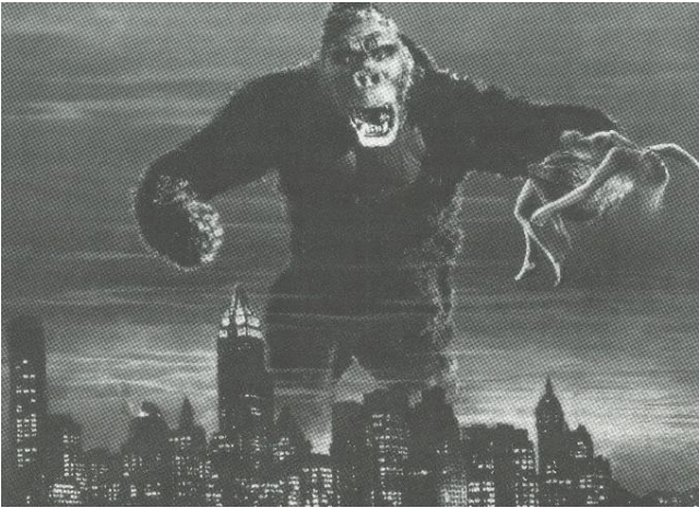
Kuva 2: Yhdysvaltalaisen RKO-yhtiön King Kong -elokuvan juliste vuodelta 1933. Lähde: Felipe Fernández-Armesto: Millennium. Toinen vuosituhat . Suom. Heikki Eskelinen, WSOY, Helsinki 1996.