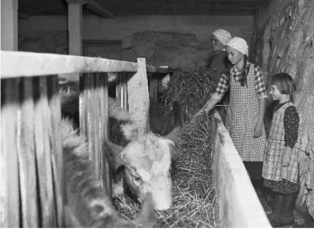
Kuva 1: Pekka Kyytisen 1930-luvun puolivälissä ottama kuva otsikolla ”Lehmiä ruokitaan Torikan tilan navetassa”. Finna.fi, Museovirasto.