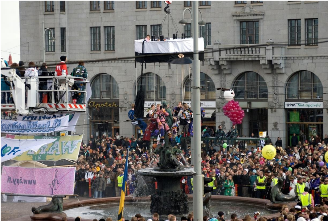
Kuvateksti: ”Vappuaatto 2007 Kauppatorilla. Mantan lakitus alkamassa, roikkuvat teekkarit patsaan vieressä. Havis Amandan kuntoa varjellakseen teekkarit turvautuvat nosturiin.”

Tehtävä 3b. Kuva-analyysi. Analysoi kuvia 1 ja 2 valintakoe kirjasta lukemasi perusteella.