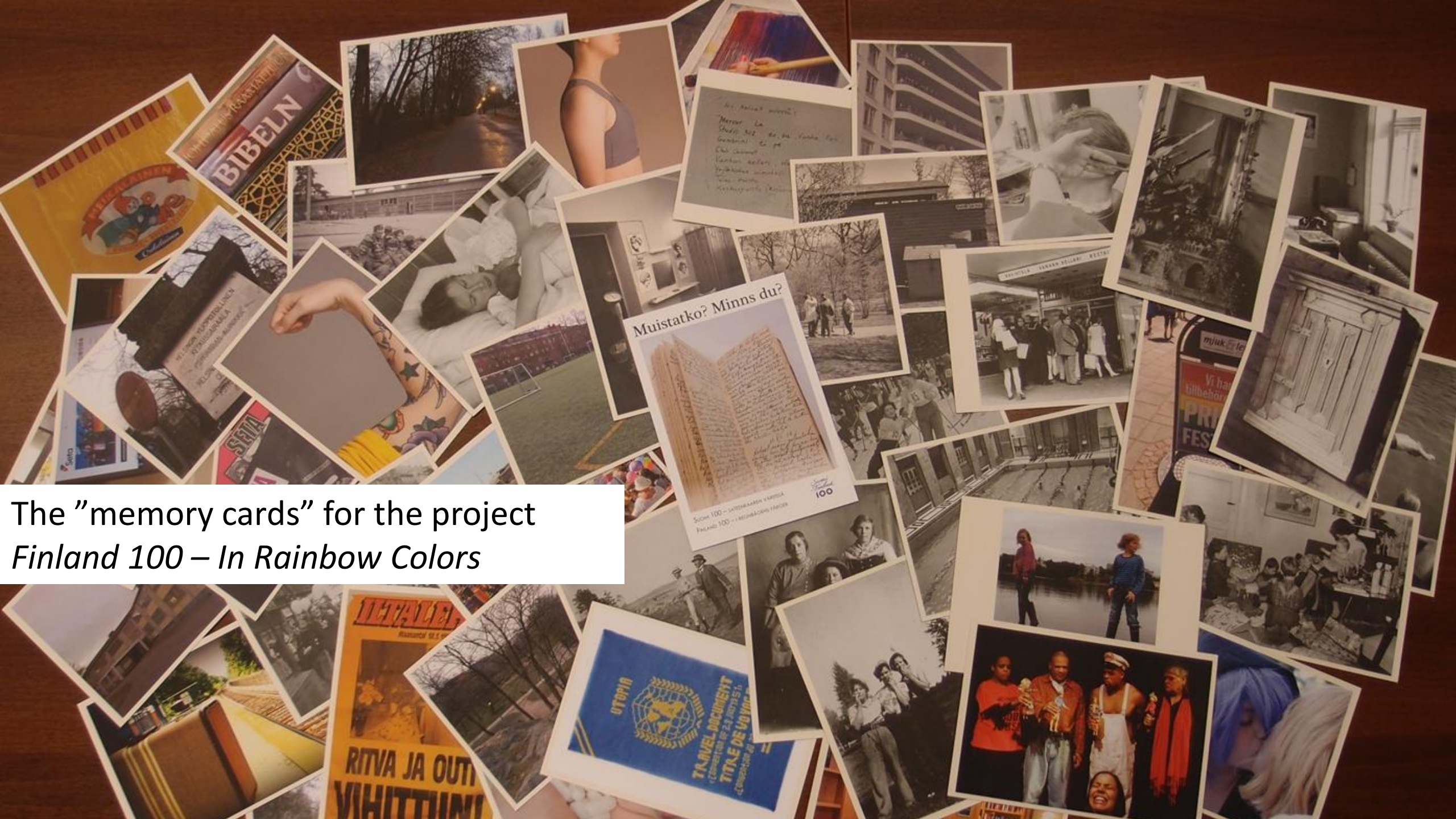
The "memory cards" for the project Finland 100 – In Rainbow Colors