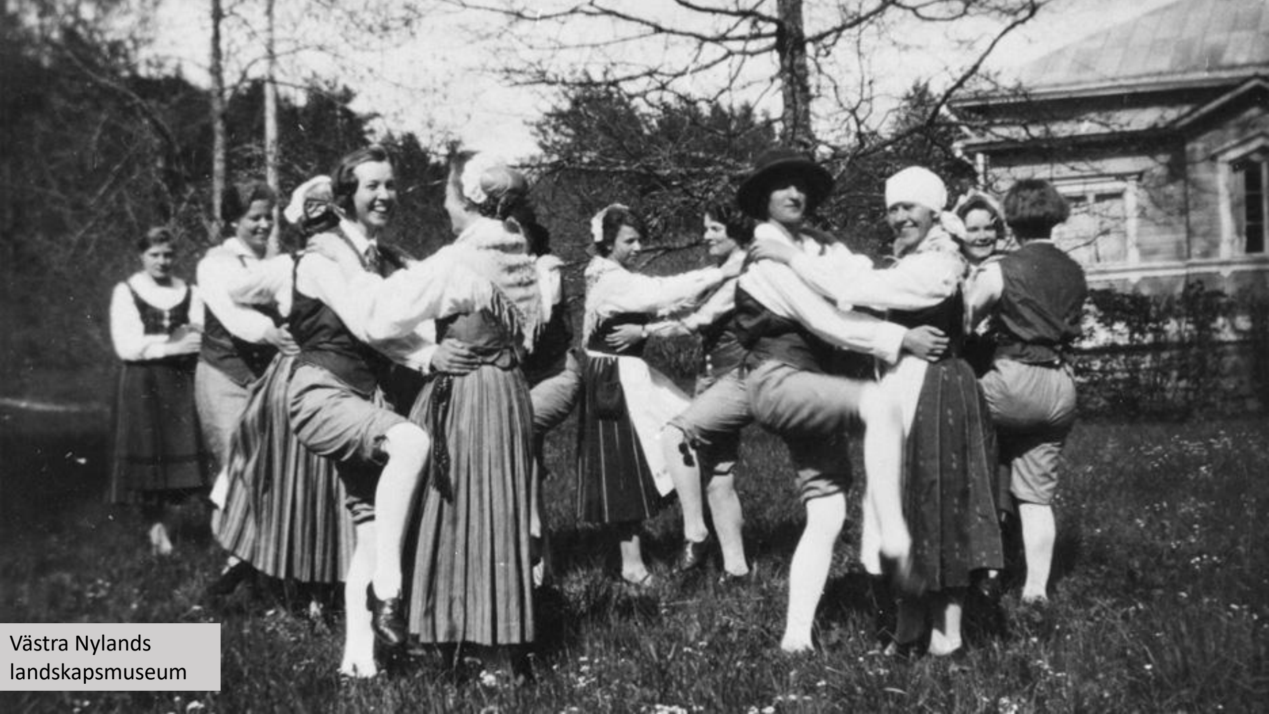
Västra Nylands landskapsmuseum