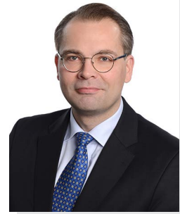
Jussi Niinistö Puolustusministeri

Euroopan unioni on nopeiden kansainvälisten muutosten ja lähiympäristössään tapahtuneiden sotilaallisten kriisien myötä herännyt kasvaneeseen tarpeeseen tiivistää sisäistä puolustusyhteistyötään. Puolustusta tulee unionissa kehittää aktiivisesti muiden yhteistyösuhteiden ja kansallisten ratkaisujen rinnalla, merkitykseltään kasvaneena osana jäsenvaltioiden yhteistoiminnan kokonaisuutta.