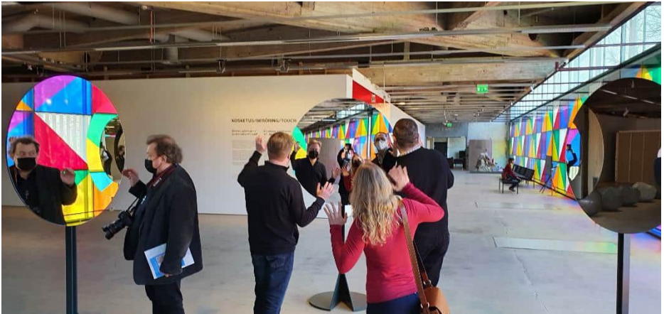
Peilailua Johtolankoja juurillemme -näyttelyssä.

Oppiaine teki kevätretken Johtolankoja juurillemme -näyttelyyn Espooseen. Samalla tutustuttiin Lohjan ja Espoon keskiaikaisiin kivikirkkoihin.