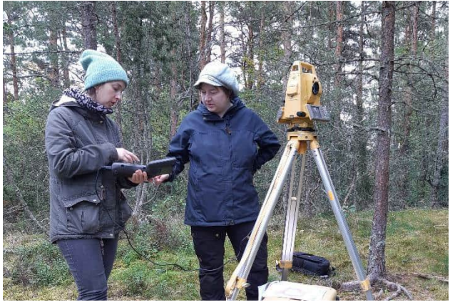
Mittausharjoituksilla Liedon Pettisissä.

Liedon Pettisissä ja Kaarinan Muikunvuorella. Lisäksi tehtiin pieni-muotoinen tutkimus Paraisten (ent. Korppoon) Rauvaisten kivi-kautisella asuinpaikalla, jossa tavoitteena oli kohteen kartoitus sekä näytteenotto mahdollista luonnon-