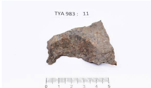
Porfyryri-iskos Paraisten (ent. Korppoon) Rauvaisten kivi-kautiselta asuinpaikalta.

Arkeologian oppiaineelta löytyvät tarvittavat välineet myös kenttätutkimuksiin, lapioista laserkeilaimen. Lisäksi käytössä on tarkempia instrumentteja löytöjen tutkimiseen sekä useita ohjelmia mittaustulosten käsittelyyn ja analysointiin.