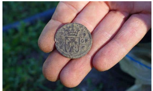
Tammelan Portaan Kappelinpellon tutkimuksissa löytynyt 1600-luvun raha löytäjän kädessä.

Vuonna 2022 kokoelma karttui seitsemällä pää-numerolla. Osa on rautakauden tutkimuksiin liittyviä aineistoja, kuten Liedon Pettisten opetuskaivauksen löydöt (TYA 985). Kirjo on kuitenkin laaja; Kenttätyökurssi 2 yhteydessä talteen otetut Paraisten (ent. Korppoon) Rauvaisten löydöt (TYA 983:1–33) ovat kivi-kautisia, Tammelan Portaan Kappelinpellon tutkimushankkeen löydöt (TYA 989:1–5) pääosin uudelta ajalta.