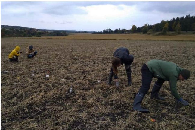
Pintapöimintää pellolla Salossa.

Vuoden 2022 inventointikurssi järjestettiin syksyn aikana edellisvuosien tapaan niin, että kurssin aluksi pidettiin kaksi luentoa, joissa esiteltiin yleisimpiä inventointimenetelmiä ja inventoinnissa käytettäviä kenttätövälineitä sekä jaettiin aiheeseen liittyvää oheismateriaalia. Kurssin kenttätöharjoitukset järjestettiin loka- ja marraskuussa Salon Veitakkalassa ja Lopella sekä Kaarinan Ravattulassa sekä Turun Haagassa. Salossa Uskelanjokeen viettävillä pelloilla harjoiteltiin sekä järjestelmällistä pintapöimintää että metallinilmaisprospektointia rautakautista asuinpaikkaa etsien ja kartoittaen. Mukana oli myös metallinilmaisinharrastajia. Ravattulassa ja Haagassa tutustuttiin eriaikaisiin muinaisjäänöksiin niitä mitaten ja dokumentoiden. Haagassa tutustuttiin maanäytekairan käyttöön ja kaivettiin koekuoppia sekä -pistoja. Kurssin aikana dokumentoitiin aiemmin tuntematon pronssikautinen hautaröykkiö. Kurssille osallistui yhdeksän arkeologian pää- ja sivuaineopiskelijaa.