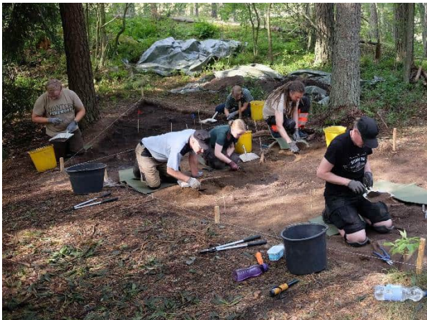
Opiskelijat kaivaustöissä opetuskaivauksella Liedon Pettisissä.

Vuoden 2022 opetuskaivaukset järjestettiin kolmen viikon aikana elosyyskuussa Liedon Pettisissä. Alkujaan metallinilmaisinharrastajien löytämällä kohteella aloitettiin kaivaukset vuonna 2019 ja niitä jatkettiin 2021. Paikalta on saatu esille laaja rautakautinen polttokalmistokokonaisuus erilaisine kalmistumuotoineen. Vuonna 2022 etsittiin polttokenttäkalmiston rajoja mäen lakialueen lähellä sekä avattiin tasokaivausalue alemmalle terassille aiemmin todetun kalmistoalueen laajuuden selvittämiseksi. Mäkialueelle kaivettiin myös monia koekuoppia kalmiston laajuuden selvittämiseksi. Kalmistoalue osoittautui jälleen kerran oletettua laajemmaksi ja perustamisajankohdaltaan oletettua vanhemmaksi. Löytö-aineisto oli runsas koostuen nuoremman roomalaisajan tai kansainvaellusajan alun