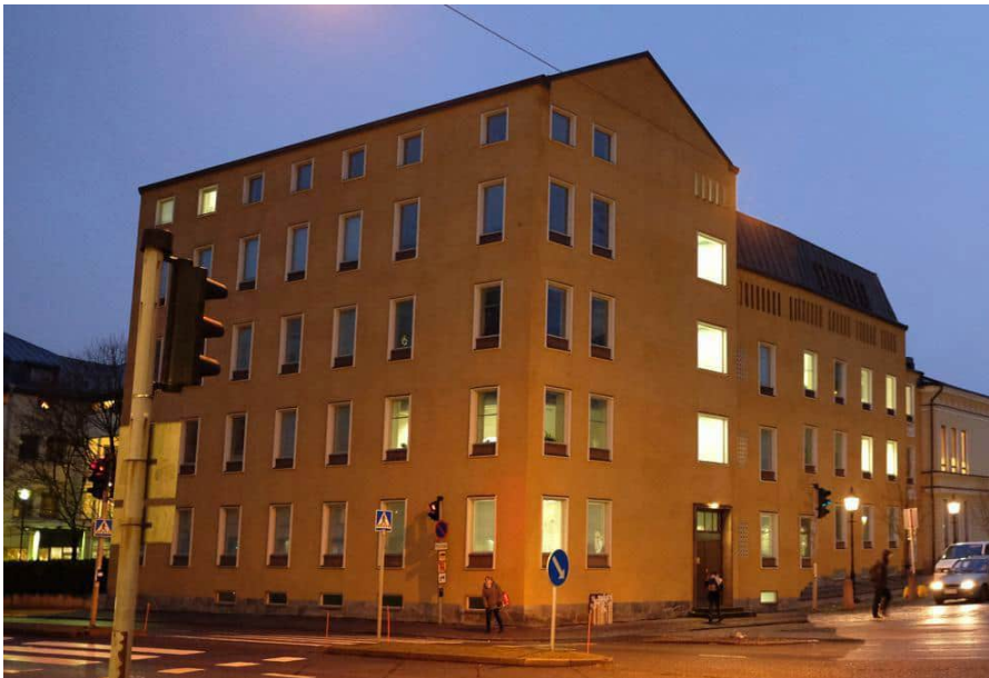
Geotalo Hämeenkadun yli nähtynä.

Hämeenkadun ja Akatemiankadun kulmassa sijaitseva, keltaiseksi rapattu Geotalo pitää sisällään arkeologian oppiaineen tilat. Vuonna 1950 valmistunut rakennus, toiselta nimeltään Chemicum, on Erik Bryggmanin suunnittelema ja piti ennen sisällään Åbo Akademin kemianlaitoksen. Arkeologian oppiaine muutti rakennukseen elokuussa 2016 sen peruskorjauksen valmistuttua. Oppiaineen opetus-, tutkimus-, kokoelma- ja arkistotilat sijaitsevat Geotalon ensimmäisessä kerroksessa. Rakennuksen toinen ja kolmas kerros ovat kotipaikkana Turun yliopiston ja Åbo Akademin geologian oppiaineille ja sisältävät muun muassa tilat laboratoriotyöskentelyyn. Lisäksi yhteisiä varasto- ja tutkimustiloja löytyy kellarista ja ylemmistä kerroksista. Fyysinen läheisyys mahdollistaa myös tieteidenvälisen yhteistyön ja geologeilta löytyvätkin laitteet esimerkiksi ohuthietutkimukseen ja XRF-analyysiin.