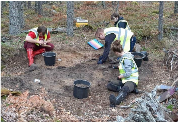
Kaivaminen käynnissä Paraisten (ent. Korppoon) Rauvaisten kivi-kautisella asuinpaikalla.

tieteellistä ajoitusta varten. Varsinaisen kaivamisen osalta tutkimus kohdistui ylösalaisin olevan puun juurakkoon, jossa oli havaittu mahdollisesti palaneita kiviä. Tutkimus vahvisti tämän eli paikalla on