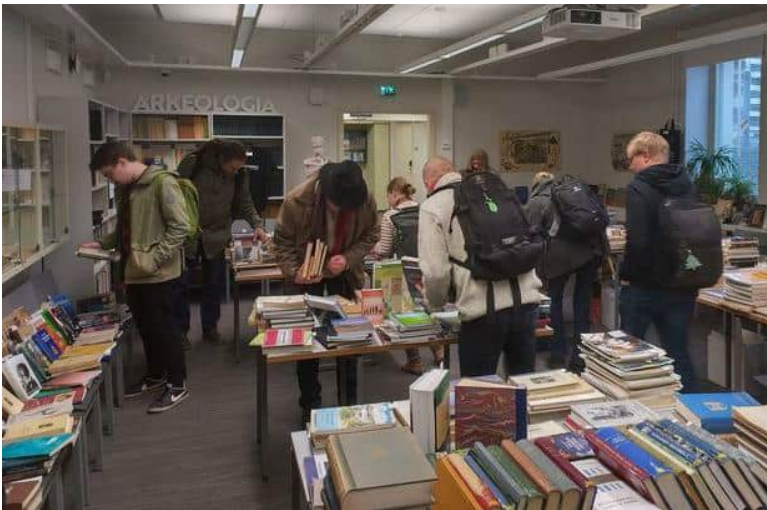
Oppiaineen kirjamyyjäiset houkuttelivat jälleen paljon väkeä Geotalon luentosaliin.

17.-18.11. Geotalolla järjestettiin oppiaineen kirjamyyjäiset.