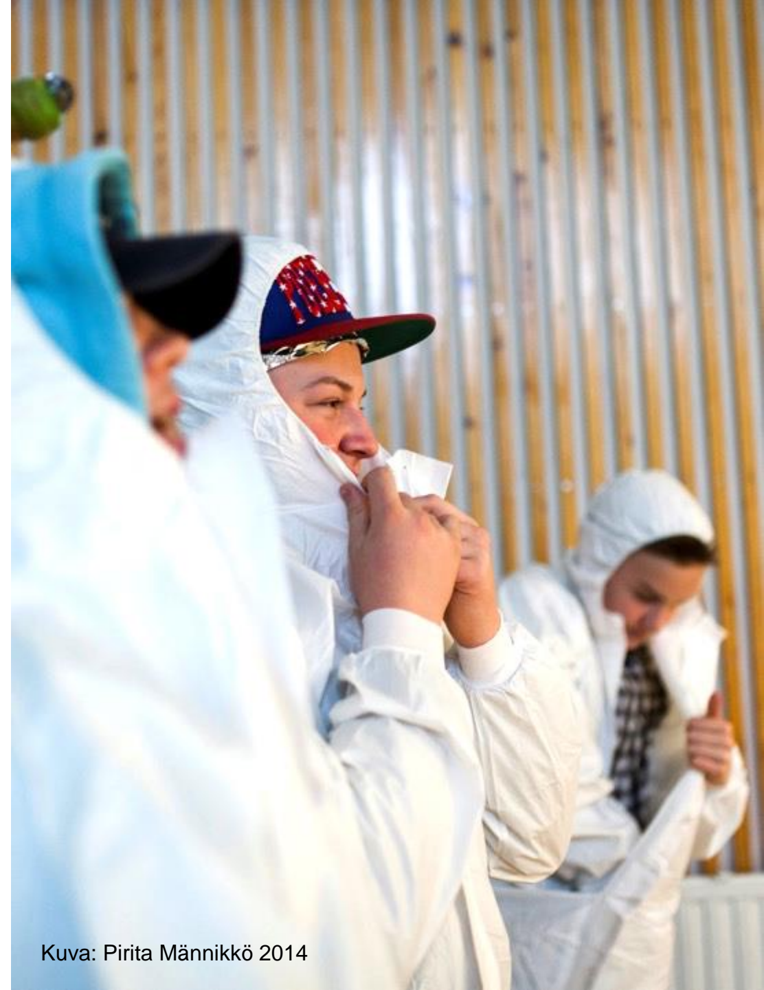
Kuva: Pirita Männikkö 2014