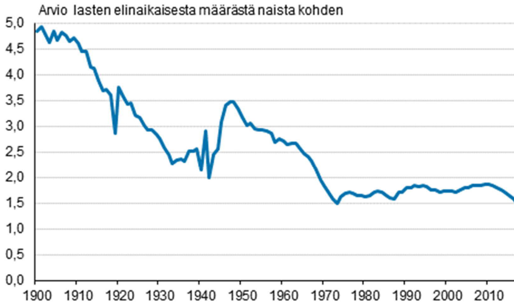
Kuvio 1. Kokonaishedelmällisyysluku Suomessa 1900–2017